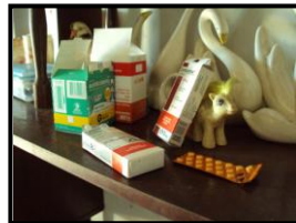
FOTO 2- Local de armazenagem - Cozinha