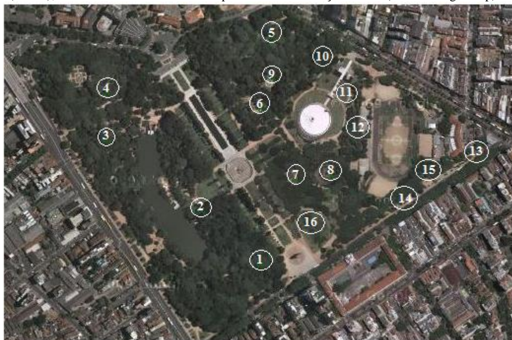
Figura 1 – Localização das regiões de amostragem no Parque Farroupilha, Porto Alegre, RS. 1 - Mata à esquerda do Monumento ao Expedicionário; 2 - Proximidade do Lago; 3 - Após o lago, próximo a Av. João Pessoa; 4 - Recanto atrás do minizoo; 5 - Próximo à Rua Paulo Gama, atrás do Inst. de Educação Flores da Cunha; 6 - Recanto Oriental; 7 - Pergolado Romano; 8 - Recanto europeu; 9 - Recanto Solar; 10 - Lateral da Av. Osvaldo Aranha, intervalo entre as ruas Santo Antonio e Garibaldi; 11 - Gramado em frente ao Auditório Araújo Viana; 12 - Lateral do Parque Ramiro Souto, na altura das arquibancadas, entre o prédio da administração e a lateral do Auditório Araújo Viana; 13 - Alameda ao longo da Av. José Bonifácio, desde o Mercado do Bom Fim até o Parque de diversões; 14 - Alameda ao longo da Av. José Bonifácio, desde o Parque de diversões até a Praça infantil; 15 - Corredor entre o Parque Ramiro Souto e os fundos da Sociedade Esportiva Recanto da Alegria (Soeral); 16 - Entre o Monumento ao Expedicionário e a Praça infantil. (Fonte: Google map).

A partir dessas observações e anotações, foi feita a análise da diversidade de espécies por região observada, através da determinação da riqueza de espécies (TOWNSEND ET AL, 2006), assim como a análise percentual da frequência de ocorrência de cada espécie nas regiões observadas, determinada pela razão do número de regiões com registro da espécie pelo total de regiões observadas ( \times 100 ). De acordo com a frequência de ocorrência, as espécies foram classificadas nos seguintes “status”: comum (frequência acima de 50%), incomum (frequência de 25% a 49%) e rara (frequência abaixo de 25%).