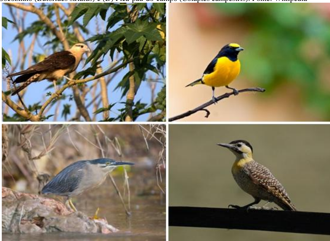
Figura 2 – (A) Gavião carrapateiro ( Milvago chimachima ), (B) Fim-Fim ( Euphonia chlorotica ), (C) Socozinho ( Butorides striatus ) e (D) Pica-pau-do-campo ( Colaptes campestris ).

A maioria das espécies observadas foi classificada como rara (Tabela 1). Um menor número como incomum e apenas duas espécies como comuns. Dentre as espécies mais frequentes, podemos citar: Sábida-laranjeira ( Turdus rufiventris ), Pombo doméstico ( Columba livia ), Pardal ( Passer domesticus ), Corruíra ( Troglodytes aedon ) e Bem-te-vi ( Pitangus sulphuratus ).