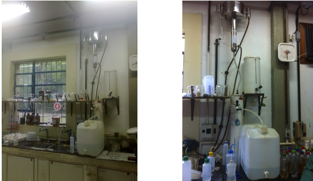
Figura 1. Fotos do destilador do Leamet no Centro de Tecnologia da UFRGS.

O cálculo do consumo de água antes de iniciar o processo de destilação foi realizado no local contando-se o tempo necessário para a geração de 1 litro de efluente, medido em proveta graduada. O volume total foi calculado multiplicando-se este resultado pelo tempo total necessário para iniciar o processo de destilação.